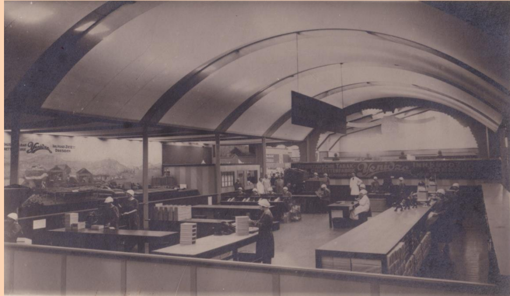
Verpackungssaal im Erdgeschoss, Zigarettfabrik Yenidze, 1920

Ακόμη και σήμερα, εξάλλου, μπορεί κάποιος να βρει στη Δρέσδη ίχνη εκείνης της ανθηρής γερμανικής καπνοβιομηχανίας, που προμηθευόταν τα καπνά της από την περιοχή της υπό Οθωμανική κατοχή Μακεδονίας.