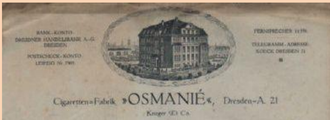
Briefkopf der Dresdner Zigarettten-Fabrik Osmanié, 1918

Η πρώτη εταιρεία σιγαρέττων της Γερμανίας, με αρχικά επτά εργαζόμενους, ιδρύθηκε το 1862 στη Δρέσδη ως αντιπροσωπεία της ρωσικής εταιρείας Laferme από την Αγία Πετρούπολη.