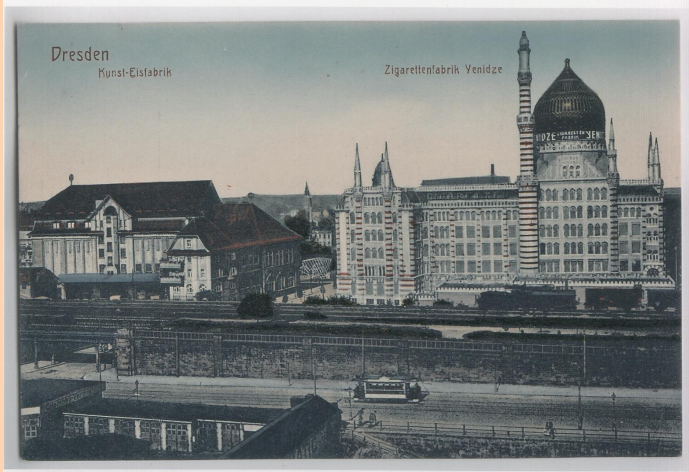
Yenidze mit Kristalleisfabrik. Postkarte, 1935

... έχτισε το εργοστάσιό του ώστε να έχει τη μορφή μουσουλμανικού τζαμιού και το ονόμασε, όπως και την εταιρεία του,