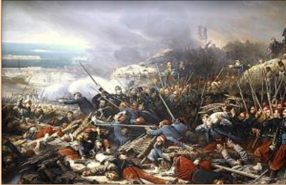
Η Μάχη της Σεβαστούπολης, 1855