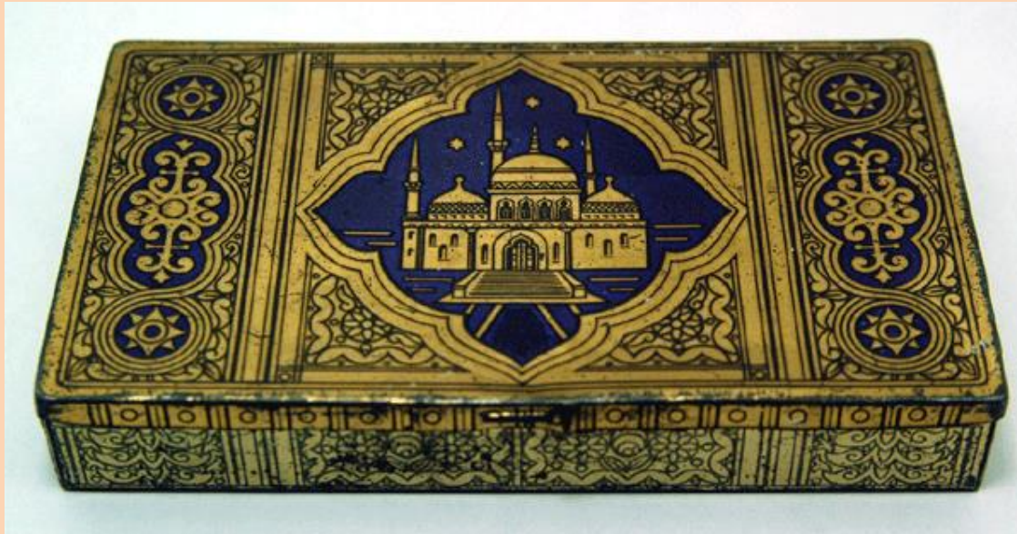
Orientalisierte Dose der Dresdner Zigarettenfabrik Orami, Marke „Große Vierer“, um 1900 (privat)

Χαρακτηριστικό είναι το γεγονός ότι μεταξύ του 1877 και 1913 παραγόταν στη Δρέσδη σχεδόν το 50% των σιγαρέττων της Γερμανίας.