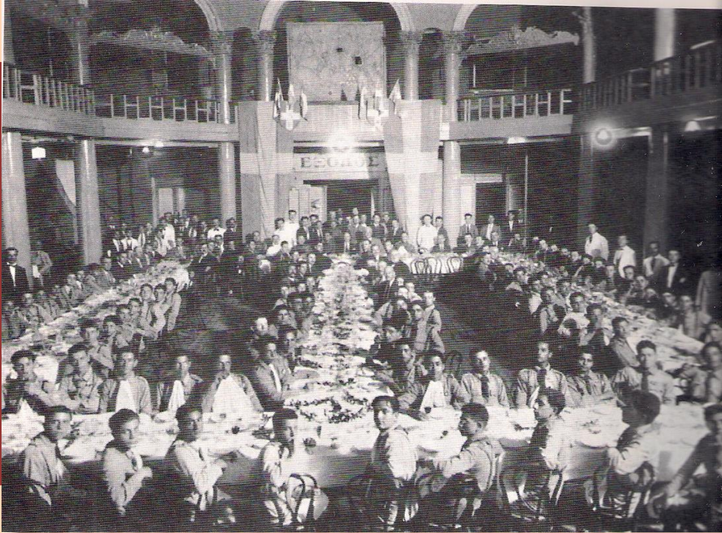
Συνεστίαση προσκόπων στο Μεντιτερανέ, 1926