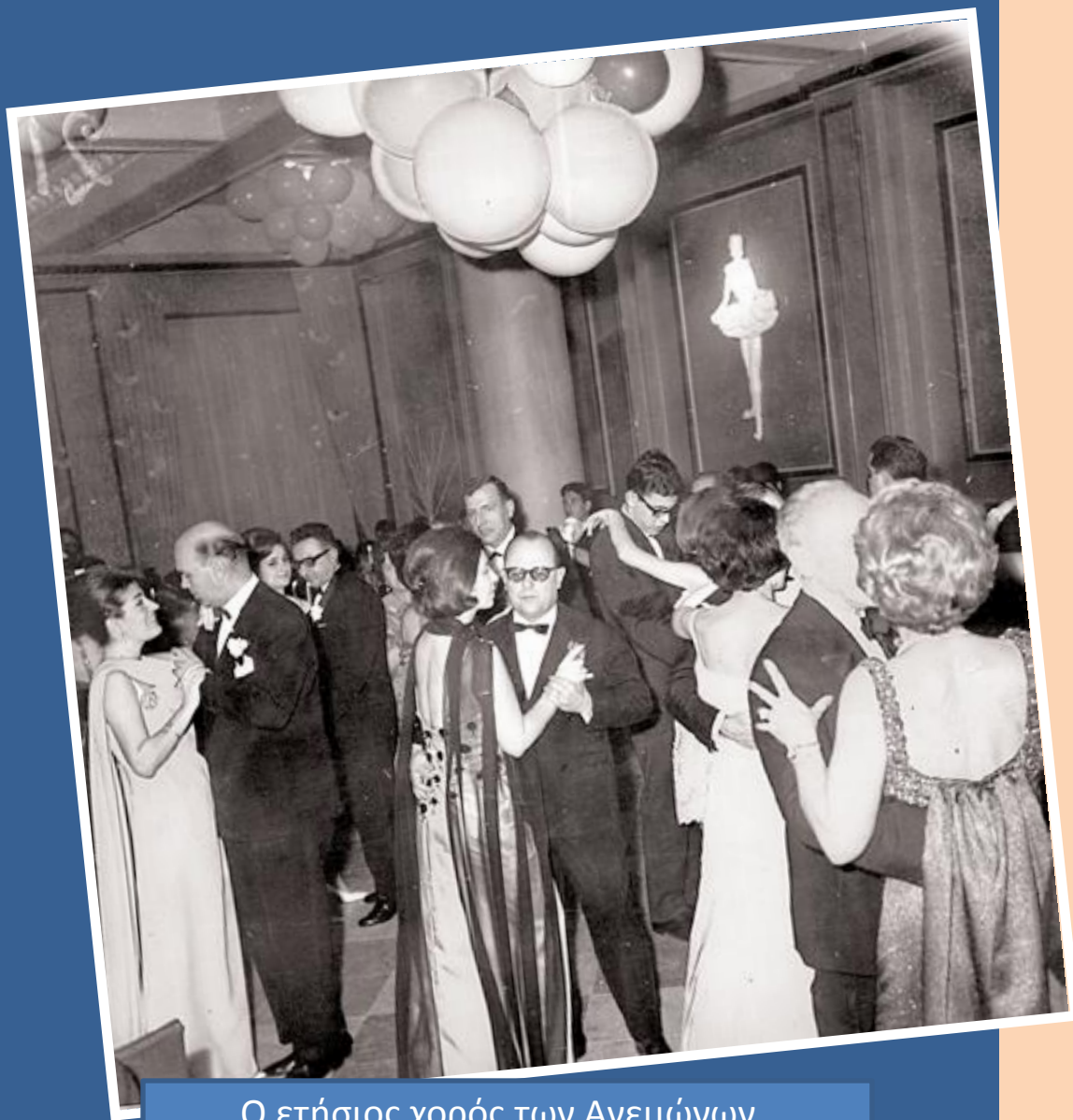
Ο ετήσιος χορός των Ανεμώνων . Ξενοδοχείο Μεντιπερανέ, 1965