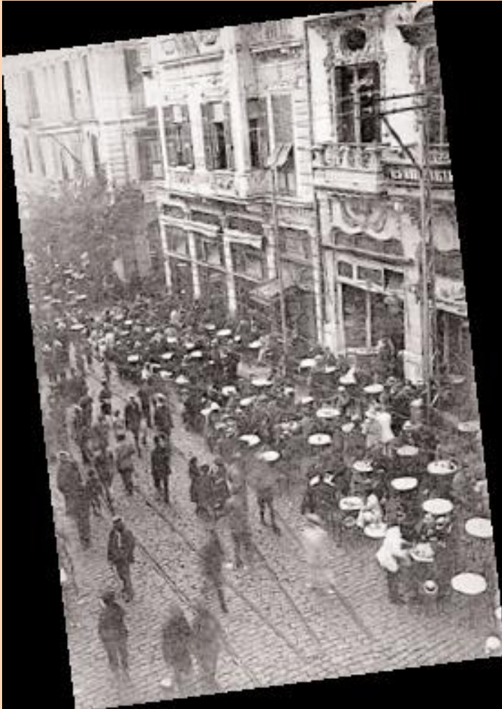
Απόψεις της πόλης στα τέλη του 19 ου και αρχές του 20 ου αι.