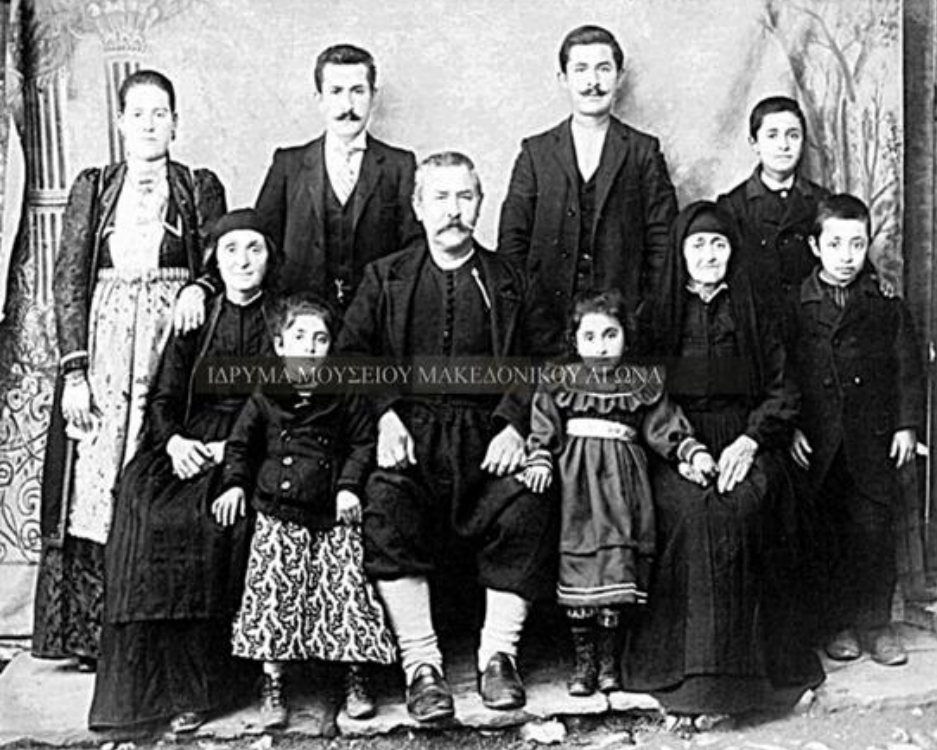
Συλλογική αναμνηστική φωτογραφία οικογένειας Βλάχων από το Συρράκο Ιωαννίνων, αρχές 20 ου αι. Συλλογή Α. Κουκούδη, Ι.Μ.Μ.Α.

Αυτοί οι άνθρωποι αποτελούν, ήδη από τα τέλη του 17 ου και τις αρχές του 18 ου αι., φορείς της εμπορικής επικοινωνίας μεταξύ της Οθωμανικής Αυτοκρατορίας και της Αψβουργικής Μοναρχίας, που εγκαινιάστηκε με τις συνθήκες του Κάρλοβιτς (1699) και του Πασάροβιτς (1718) και εντάθηκε στα τέλη του 18ου και τις αρχές του 19ου αιώνα.