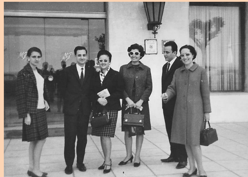
Στην είσοδο του Μεντιτερανέ, 1965